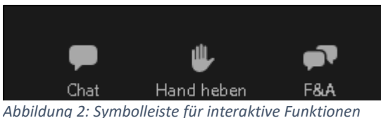
Abbildung 2: Symbolleiste für interaktive Funktionen

In Zoom stehen verschiedene Möglichkeiten zur interaktiven Teilnahme zur Verfügung, von der in der Digital Lecture allerdings nur das Tool „Fragen und Antworten“ nutzbar ist.